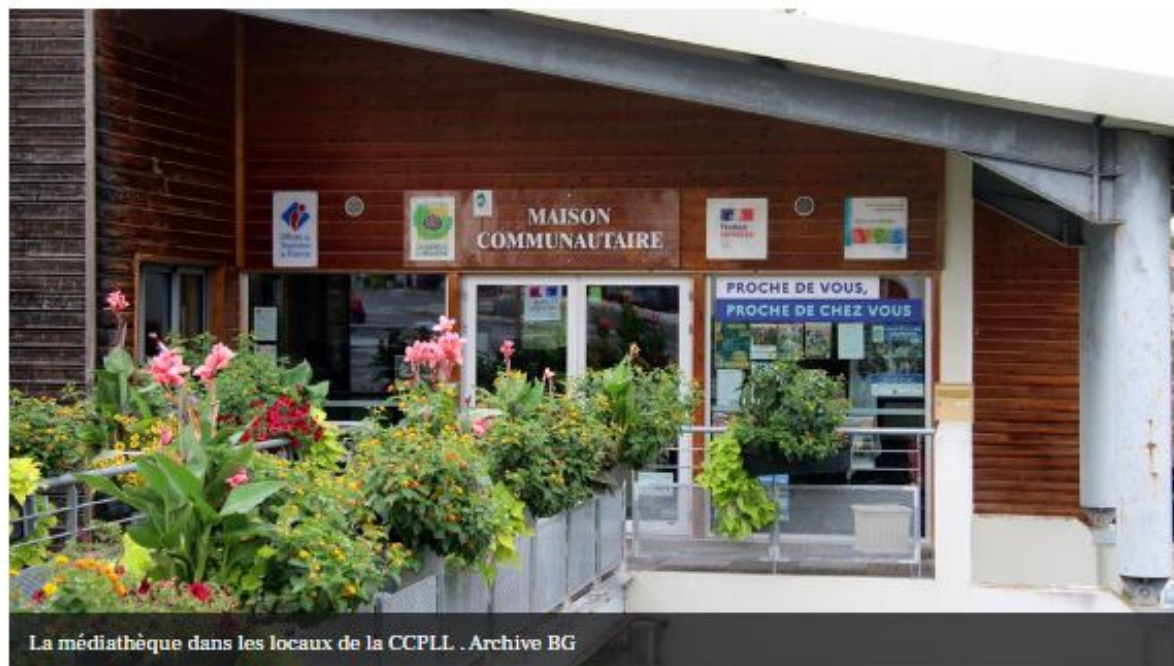
La médiathèque dans les locaux de la CCPLL .