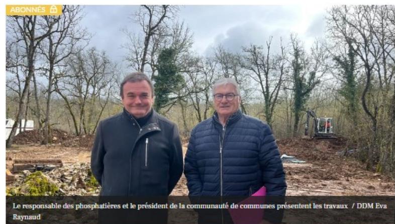
Le responsable des phosphatières et le président de la communauté de communes présentent les travaux