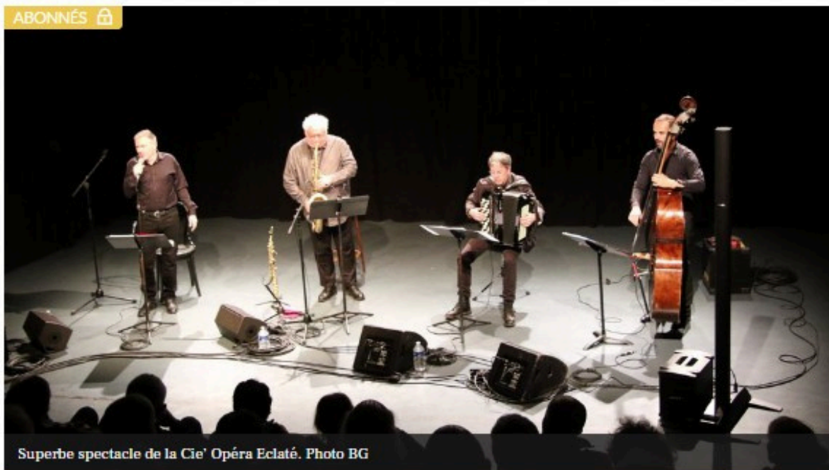
Superbe spectacle de la Cie' Opéra Éclaté.