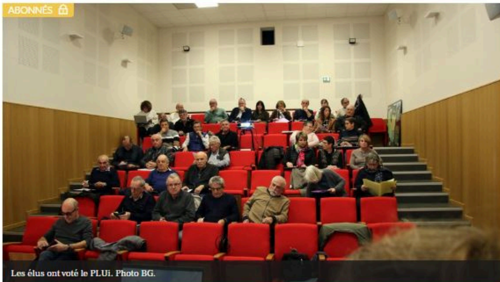
Les élus ont voté le PLUi.

Mercredi 27 novembre l'approbation du PLUi, plan local d'urbanisme Intercommunal, était à l'ordre du jour de la séance plénière du Pays de Lalbenque/Limogne. Son processus d'élaboration a débuté en 2017 et a suivi différentes étapes : validation du PADD (projet d'aménagement et de développement durable), concertation, arrêt du projet, consultation des huit PPA (personnes publiques associées), enquête publique et ajustement du dossier. Elles permettent aujourd'hui de finaliser un document au plus près des aspirations du territoire de la communauté de communes, tout en respectant le cadre réglementaire et législatif.