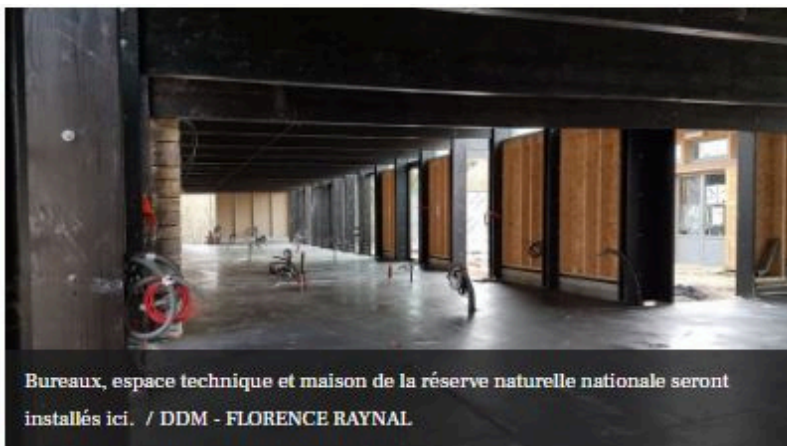
Bureaux, espace technique et maison de la réserve naturelle nationale seront installés ici.

Bref, un espace à la mesure du site "unique en France et très rare dans le monde", souligne Jean-Claude Sauvier, président de la communauté de communes du Pays de Lalbenque Limogne. La phosphatière du Cloup d'Aural est l'une de ces cavités creusées à la fin du XIX e siècle pour extraire le phosphate né de gisements de fossiles. Or le Quercy est reconnu au plan mondial pour sa concentration en fossiles sur de faibles surfaces : en quelques m 2 , on peut parcourir 30 millions d'années. Le Cloup d'Aural est un des sites phares qui ont permis au PNR d'obtenir le label Géoparc . Mais lors de la labellisation, l'Unesco avait regretté l'absence d'un tel équipement.