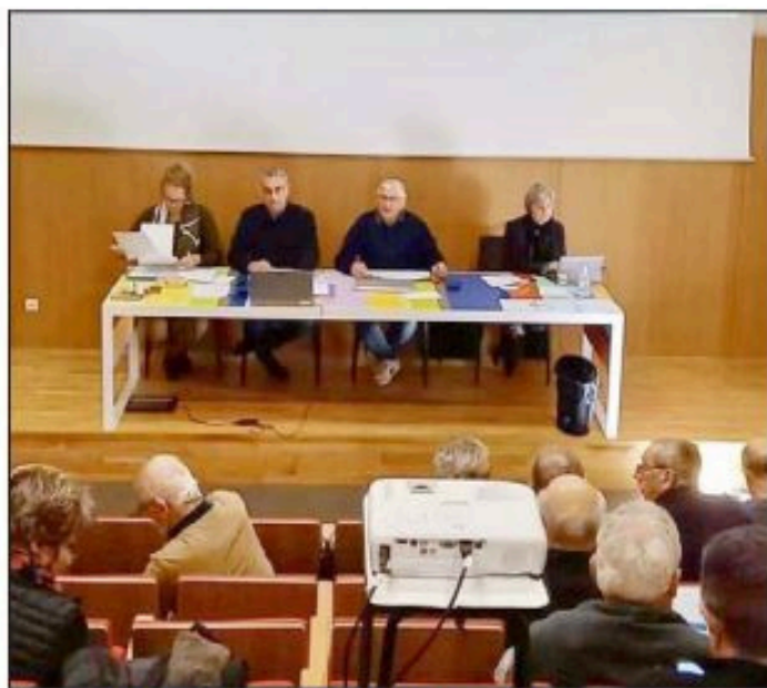
Le conseil de la CCPLL mercredi 27 novembre

été voté des subventions, au CIAS 15 500€, 600€ à l'association Babel Gum, pour la manifestation « Les Pics Nic décalés » association qui demande le changement d'attributaire à la Compagnie « La Cabriole ». Il a été ensuite question de modification du règlement d'attribution de subventions aux associations, de reversement aux communes de la part compensation Part Salaire. Pour le projet sportif et culturel la CCPL a décidé de reconduire l'aide « Projet sportif jeunes ». Concernant la maison de santé de Limogne les subventions ont été actées. Etat : 500 000 €, région 110 000€ département 110 000€ et autofinancement