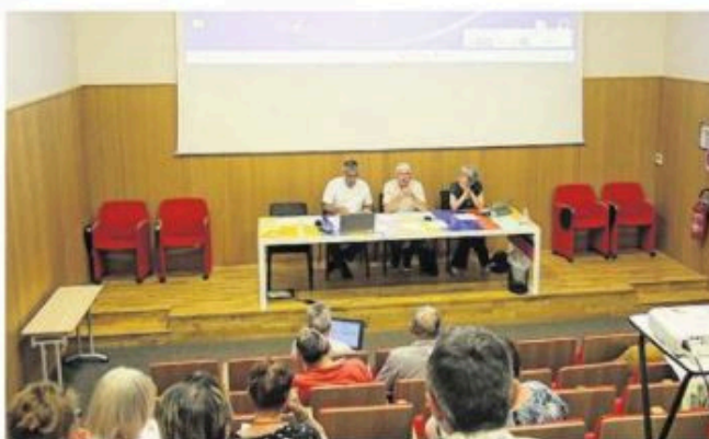
Le conseil de la CCPLL jeudi 18 juillet jlm

En second point tourisme, il a été abordé le projet de requa-