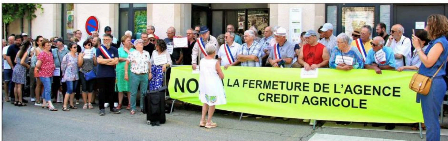
Les manifestants devant l'agence

Vendredi 19 juillet à 11h, plus de 140 personnes, élus, agriculteurs, commerçants, artisans, habitants du territoire se sont retrouvées devant l'agence du Crédit Agricole de Limogne en Quercy pour dire non à la fermeture. Elle fait partie des 7 agences lotoises faisant