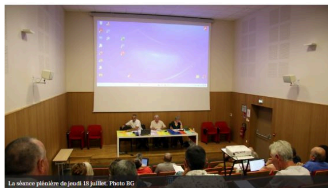
La séance plénière de jeudi 18 juillet.

Cette séance a permis de valider plusieurs projets importants et de consolider des partenariats clés pour le développement durable et la valorisation du territoire de la CCPLL.