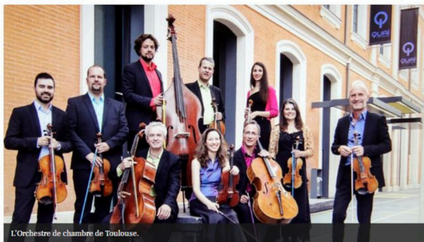
L'Orchestre de chambre de Toulouse.