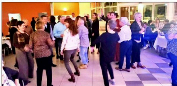
Ambiance sur la piste