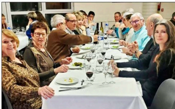
La table de la préfète et du président