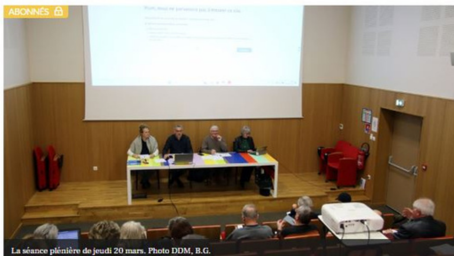
La séance plénière de jeudi 20 mars.

Jeudi 20 mars, avait lieu une séance plénière de la communauté de communes du Pays de Lalbenque/Limogne (CCPLL), à Lalbenque. À l'ordre du jour, figurait d'abord une décision concernant les bâtiments : la vente de l'ancienne trésorerie à l'Etablissement public foncier (EPF) pour le compte de la commune de Lalbenque est actée pour un montant de 150 000 €. Au rang du budget ensuite, l'inscription de crédits anticipés avant le vote du budget primitif est actée.