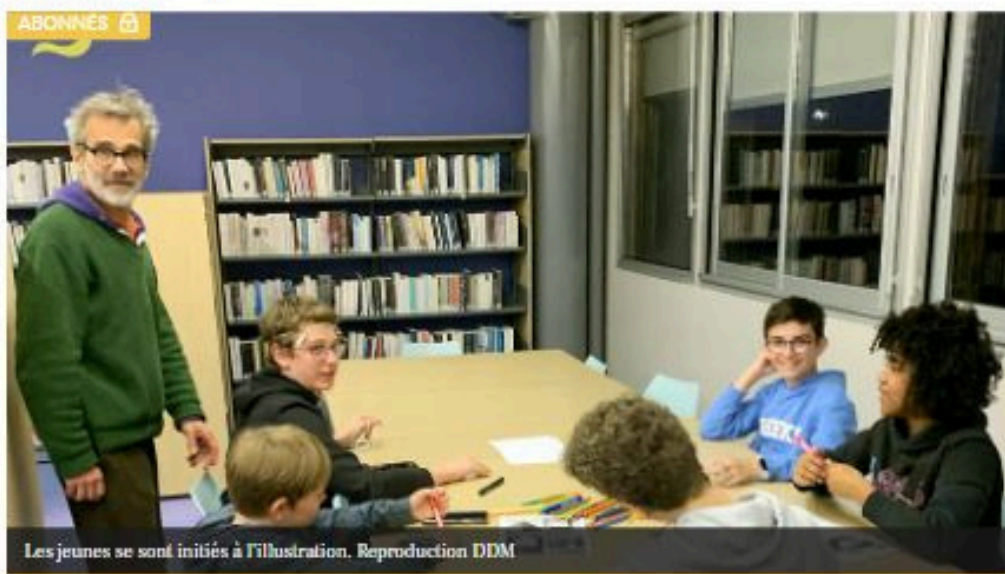
Les jeunes se sont initiés à l'illustration.

Dans le cadre de sa première résidence artistique de territoire, sur la thématique des "Identités en mouvement", le PETR Grand Quercy, en lien avec la Drac Occitanie et en collaboration avec la communauté de communes du Pays de Lalbenque-Limogne, a invité Cyrille Atlan et Aymeric Reumaux de la compagnie Les Atlantes, à arpenter le territoire du pays de Lalbenque-Limogne, ses lieux, ses paysages, son patrimoine, et à aller à la rencontre de ses habitants.