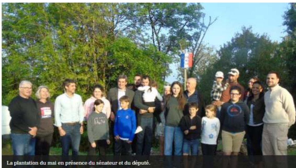
La plantation du maï en présence du sénateur et du député.

Samedi 25 avril, la commune de Berganty a renoué avec une tradition locale chère au territoire : la plantation des maïs. Tout au long de l'après-midi, les élus du conseil municipal ont parcouru la commune pour planter les maïs dans les onze maisons des onze élus, perpétuant ainsi un usage festif et symbolique du monde rural lotois. La journée s'est poursuivie en fin d'après-midi par un moment convivial aux abords de la mairie et de la salle polyvalente, avec la plantation d'un arbre, symbole d'enracinement et de renouveau pour le mandat qui débute.